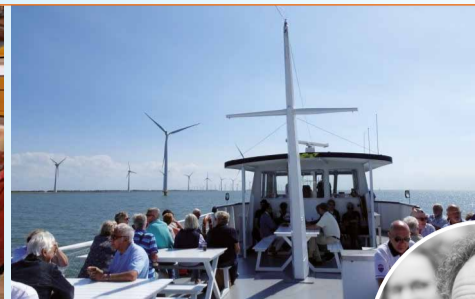
Uitstapje op boot.