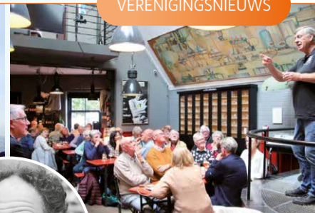
Ontmoeten en samenzijn.