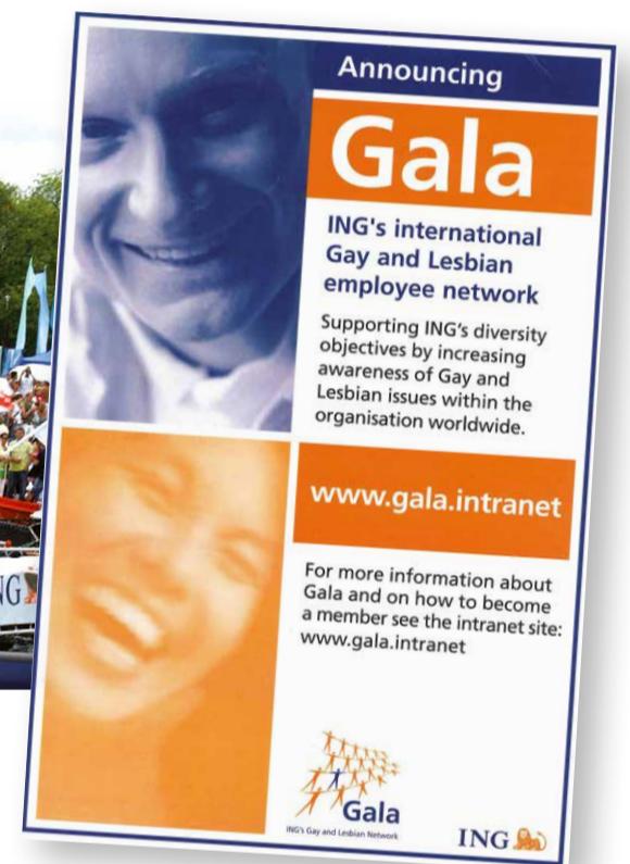
2004. Annoncing GALA. De 1ste Poster van GALA, waarmee het netwerk zich bekend maakte bij de ING-collega's.