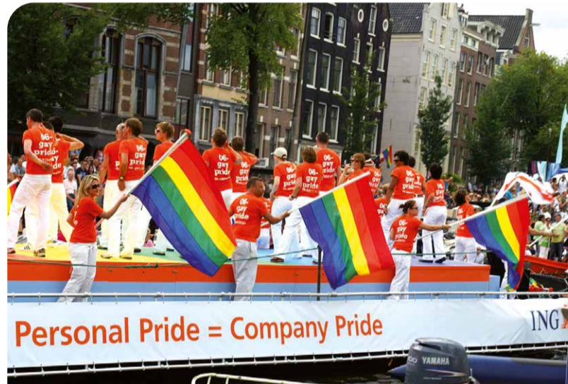
Personal Pride = Company Pride. De ING boot tijdens de Amsterdam Canal Parade van 2008.

van de ING-boot aan de Amsterdam Canal Parade. GALA trok in 2006 de kar (boot?) voor de eerste zakelijke vloot. Samen met IBM, Shell en ABN AMRO waren ze de eerste corporates die zich op deze manier representeerden tijdens de Amsterdam Pride. Uit deze samenwerking ontstond in 2008 Workplace Pride, een onafhankelijke non-profit stichting die zich inzet voor de verbetering van het leven van LBGTQI+ mensen in het bedrijfsleven. In 2011 ontwikkelde Workplace Pride de 'Verklaring van Amsterdam' en een bijbehorend keurmerk om wereldwijd zinvolle vooruitgang te boeken voor LBGTQI+ personen en een einde te maken aan pesterijen, discriminatie en ongemak op de werkplek. ING was het eerste bedrijf dat deze verklaring heeft ondertekend.